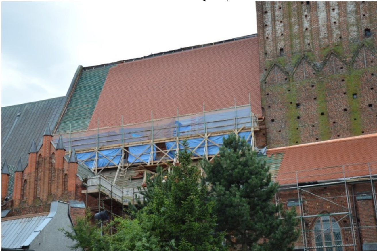
Remont dachu kościoła parafialnego w Sławnie pw. WNMP