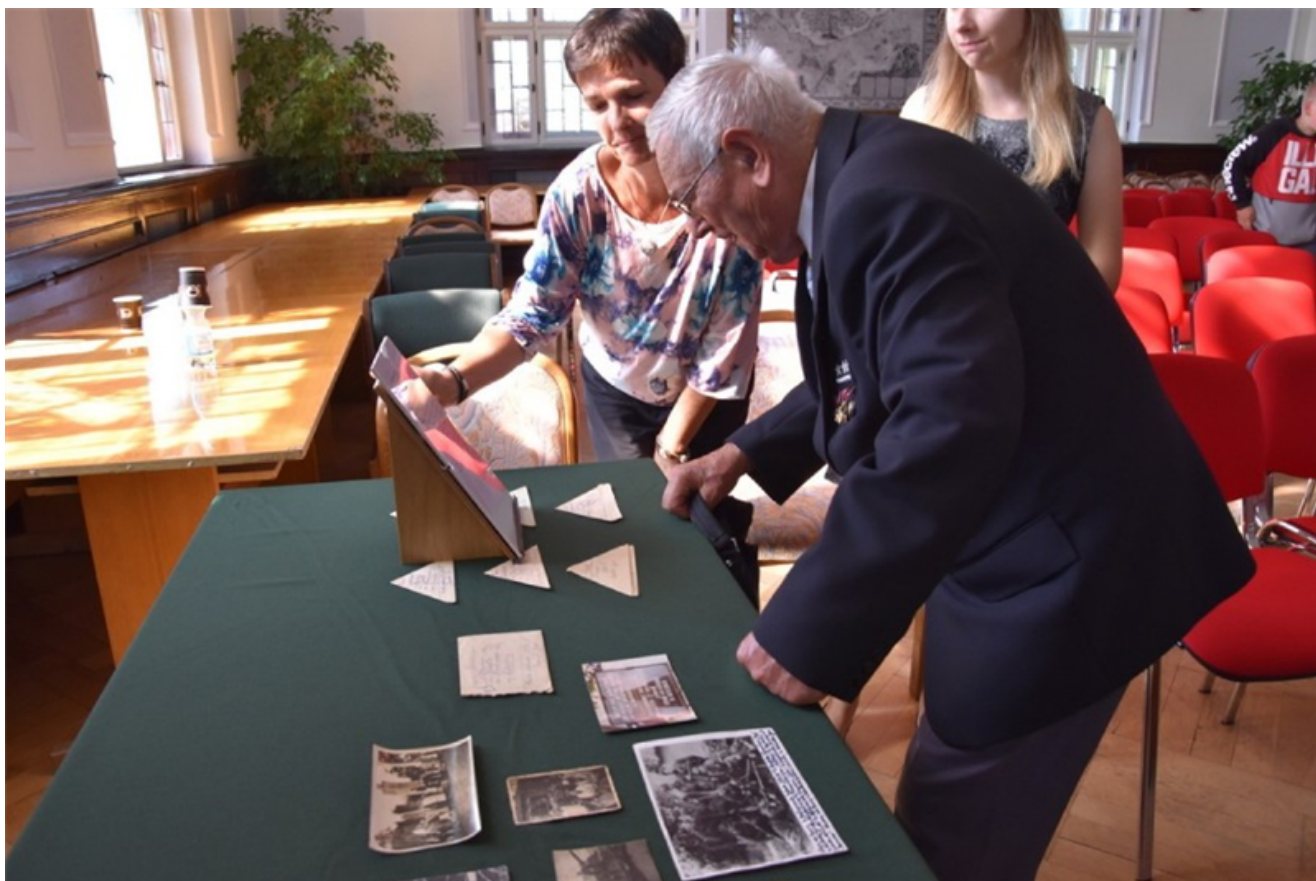
Podsumowanie Zachodniopomorskich Dni Dziedzictwa 2019