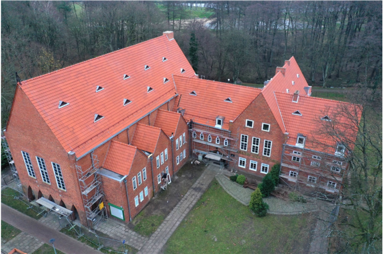
Remont dachu Sławińskiego Domu Kultury