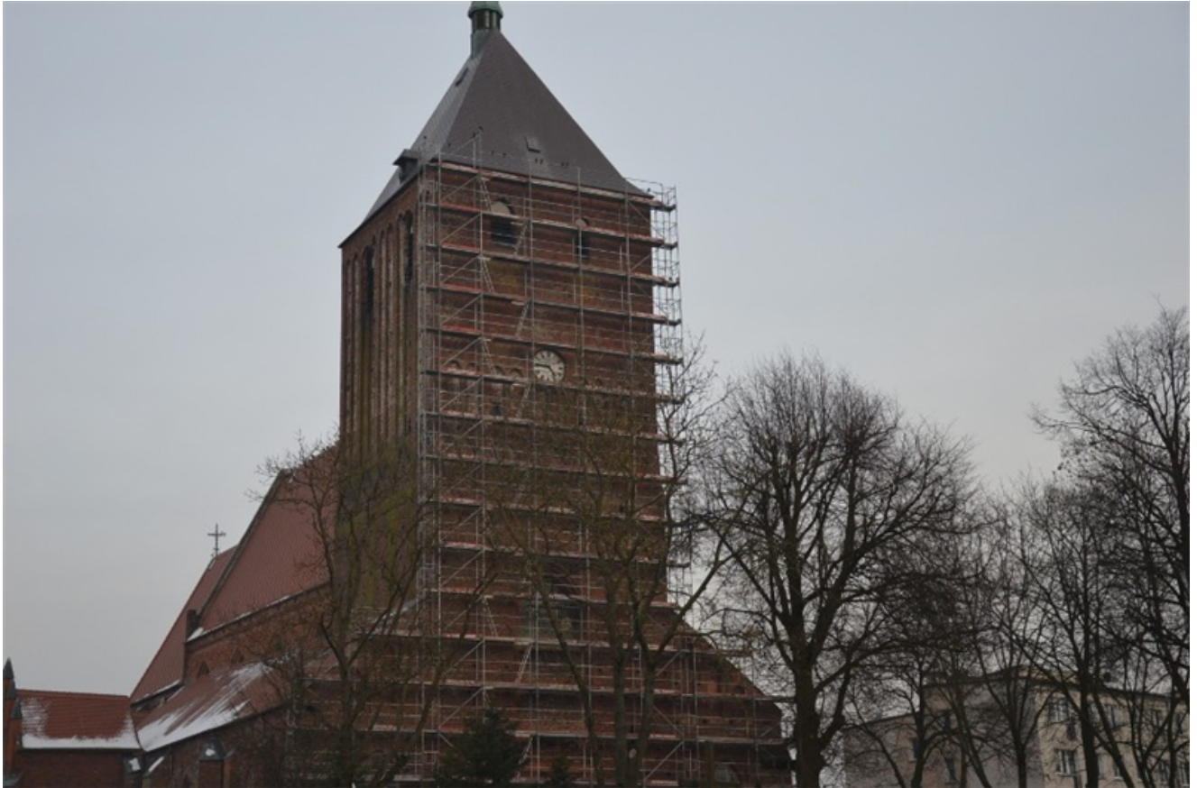
Remont murów zewnętrznych kościoła parafialnego pw. WNMP