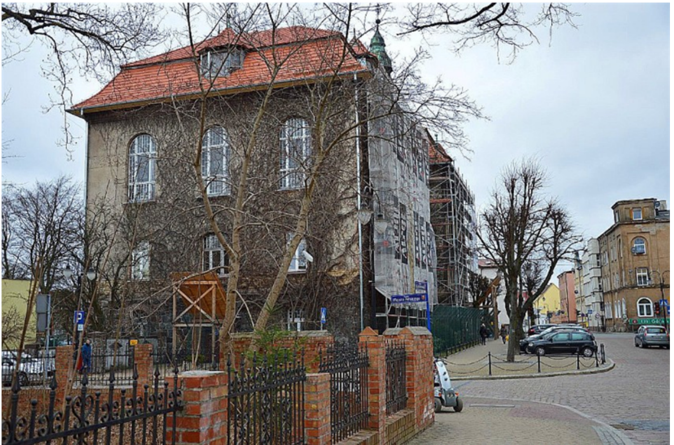
Remont dachu Sławińskiego Ratusza